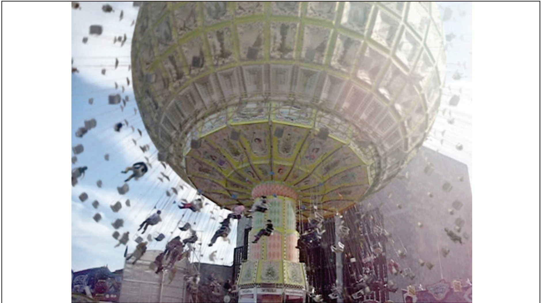
„The Centrifuge Brain Project“ (DE 2011)