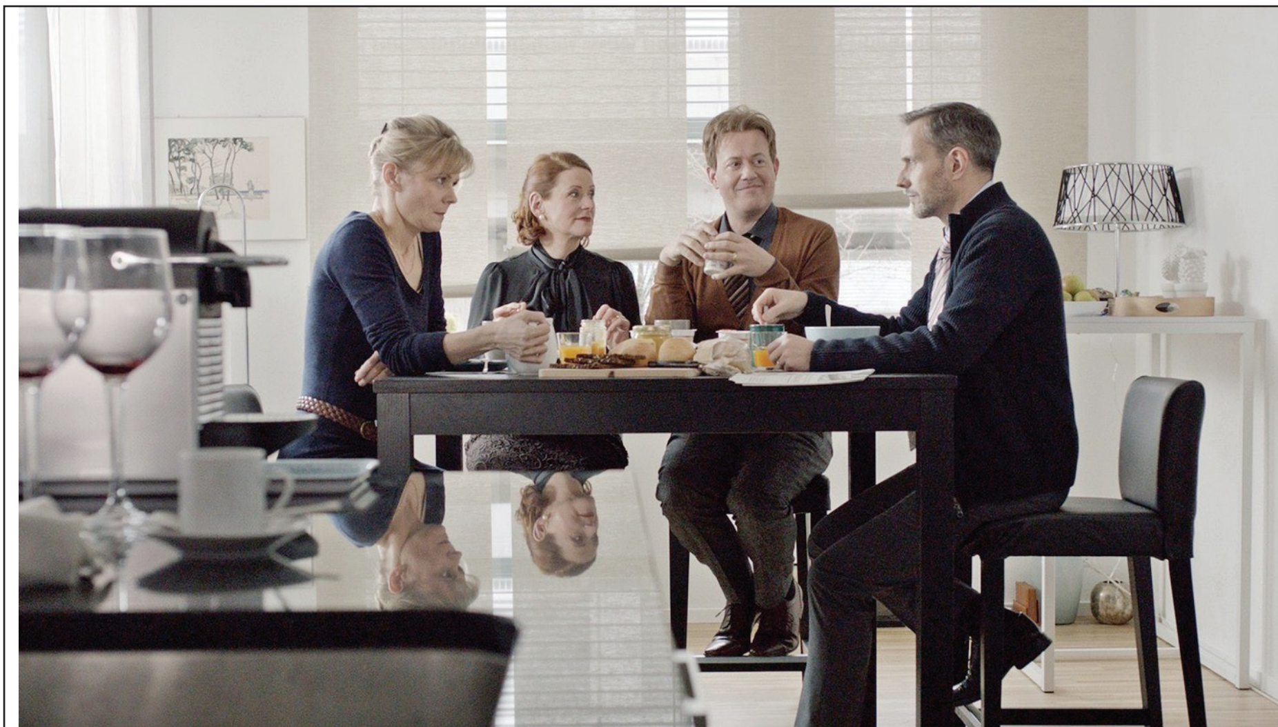
"Buumes" (CH 2012)