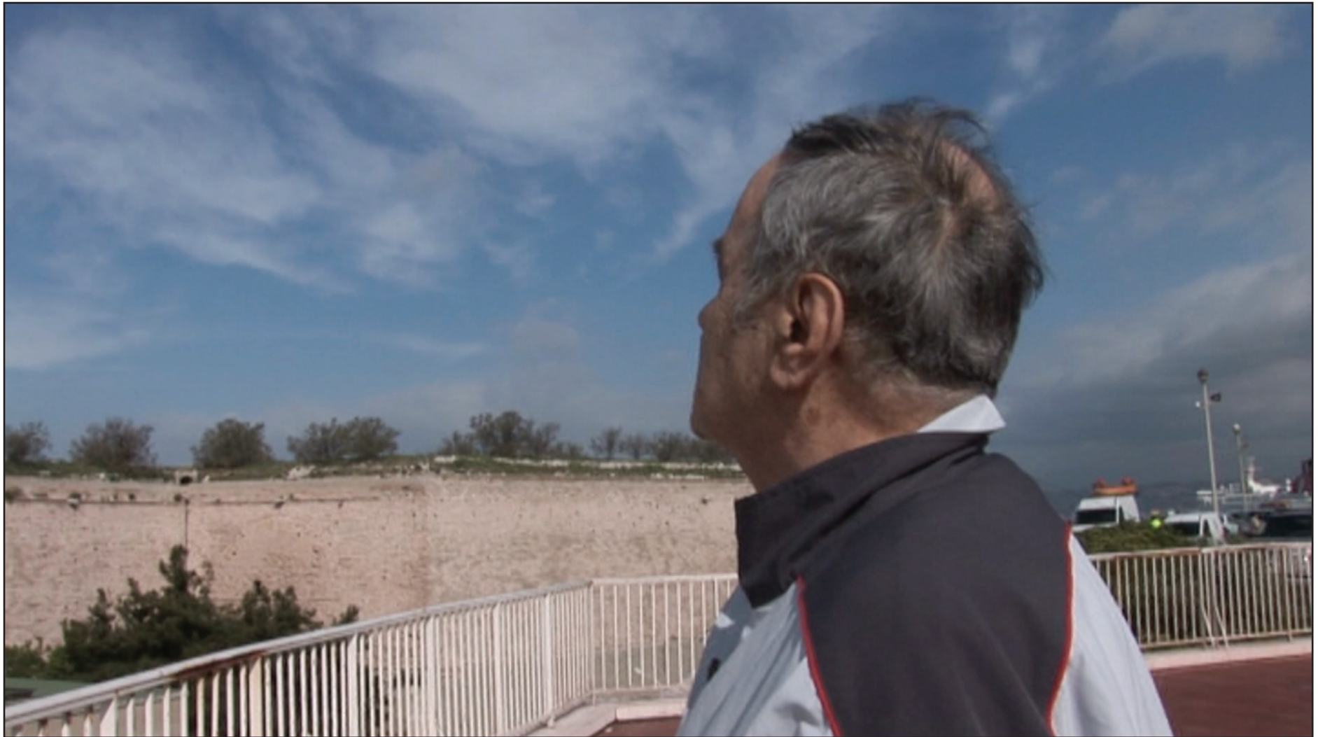
“Legionär Nr. 5720” (CH 2013) von Marianne Schneider feiert an den Emmentaler Filmtagen 2013 Premiere.