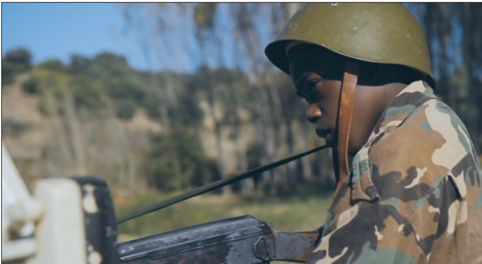
"Aquel no era yo" (ES 2012)