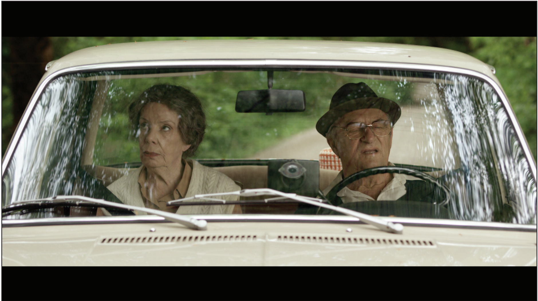
„D’Sunn scheind schee“ (DE 2012)